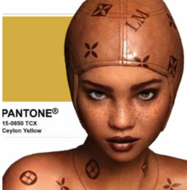
PANTONE® 15-0850 TCX Ceylon Yellow